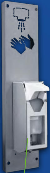
DESIWALL Platzsparende Desinfektion zum Aufhängen

Unsere Systeme für die Händedesinfektion