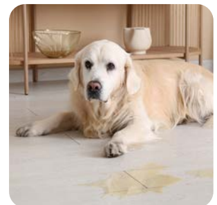
Tierheim & Co.