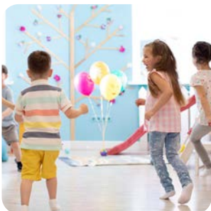
Kita & Kindergarten