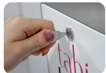
Abschließbar für mehr Sicherheit